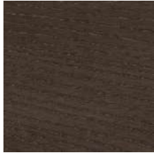
Frassino tinto moka Ash in a moka stain