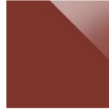
NCSS5040Y80R Rosso Cina