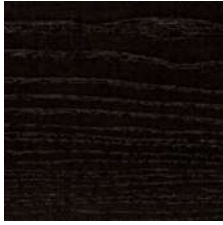
Frassino tinto Wengè Ash in a Wenge stain