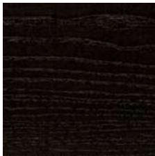
Frassino tinto Wengè Ash in a Wenge stain