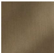
Metallo verniciato bronzo sfumato Painted metal shaded bronze