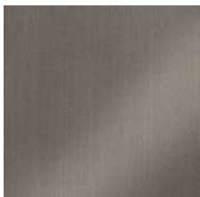
Ottone bronzato spazzolato Brushed bronzed brass