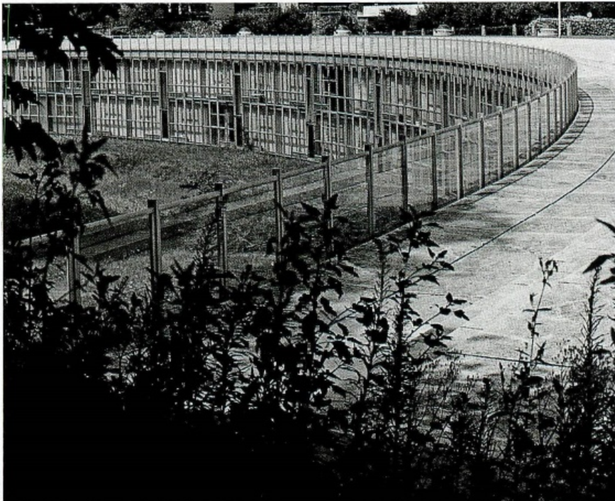
L'UNITÀ RESIDENZIALE OVEST pour Olivetti, à Ivrea, 1968-71. Roberto Gabetti et Aimaro Isola, avec Luciano Re.