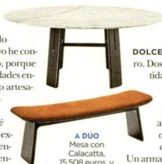
A DUO Mesa con Calacatta, 15.508 euros, y banco en piel, 2.446 euros.

taburete con gubias [esas hendiduras, a modo de escamas de la pata], formas que antes nunca las habían trabajado. Y en otro mueble que aquí no lo tenemos [se refiere al Duo Cabinet] la madera se monta de una manera que es como algo del futuro, electrónico. El resultado ha sido un Ceccotti nuevo y un Poltrona Frau nuevo y reunidos en esta colección. Ha tenido mucho éxito desde el punto de vista comercial, estamos encantados".